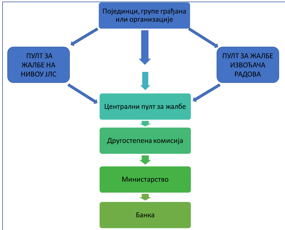
Слика 1. Шема функционисања жалбеног механизма

доноси Другостепена комисија образована решењем министра грађевинарства, саобраћаја и инфраструктуре. Организација ЖМ-а је представљена на слици 1 овог документа.